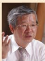
中西 輝政氏 京都大学名誉教授