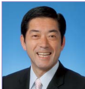
愛媛県知事 中村 時広

平成二十五年の年頭に当たり、謹んで新春のお喜びを申し上げます。松山青年会議所の皆様方におかれましては、日頃から、地域のネットワークを大切にしながら、明るい豊かな地域社会の実現に多大な御尽力を賜りますとともに、県政の推進に格別の御理解と御協力をいただいております。また、新公益法人制度施行にともなう