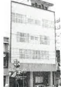
村善旅館新築落成