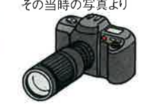
その当時の写真より