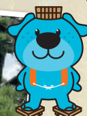
「義農精神」は 脈々と受け継がれる

義農神社 愛媛県伊予郡松前町筒井 ☎ 089-985-4120 (松前町役場 産業課 商工水産観光係)