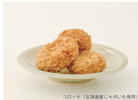
コロッケ (北海道産じゃがいも使用)