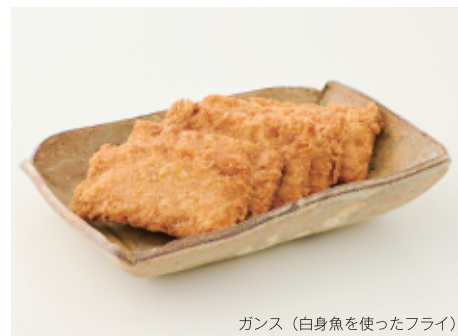
ガンス (白身魚を使ったフライ)