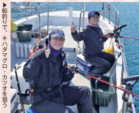
船釣りで、キハダマグロ・カツオを狙う