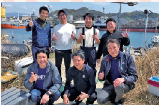
▲4月には高知宿毛の地に7名のメンバーで遠征した

松山JC釣りクラブは主に愛媛県内の港から遊漁船に乗り、船釣りをしています。3月は松山沖でメバル釣りを、4月は宿毛沖でキハダマグロ・カツオ釣りを行いました。釣りに興味がある方は是非、釣りクラブに入会してみませんか？