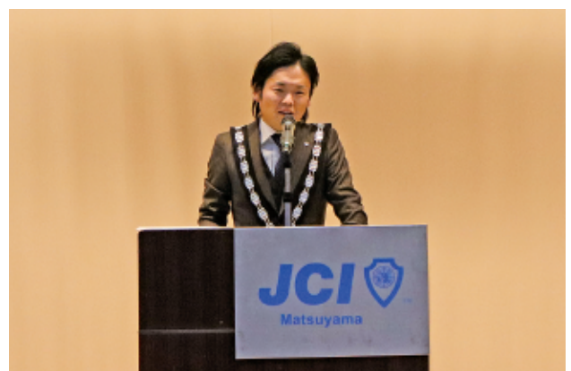
▲第1回通常総会。自らの経験を踏まえ、総会の意義をしっかりと伝える。

2024年度がスタートし、早4ヶ月。私たちの運動も日毎に厚みを増し地域の皆さまとともに運動を展開できることに喜びを感じています。これからも、子どもたちのため、若者のため、住み暮らす皆さまのために、様々な事業を行っていきます。機会がありましたら、松山青年会議所の事業に参加していただき、私たちの事を少しでも知っていただけたら幸いです。これからも引き続きのご支援、ご協力をお願いいたします。