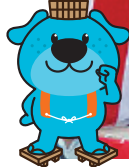
伝統芸能 義農太鼓