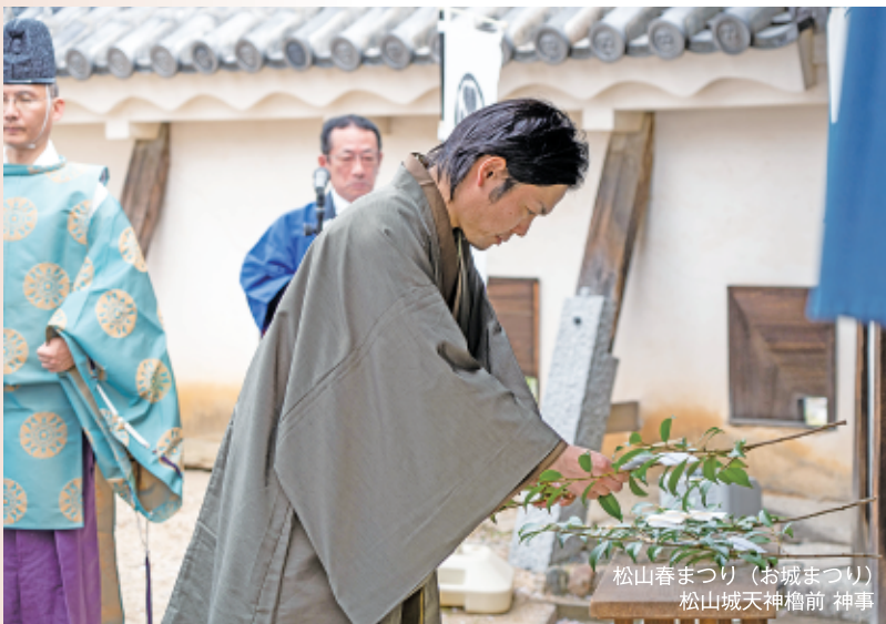
松山春まつり（お城まつり） 松山城天神櫓前 神事