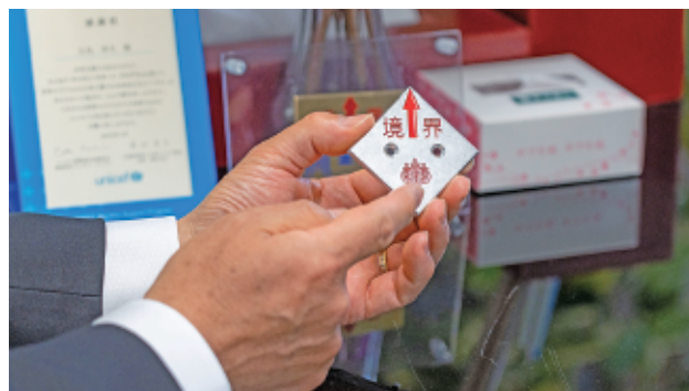
▲大切な財産である土地を管理し、登記や測量において重要な資料となる境界標。

JCは40歳で卒業するので、現役メンバーでいる期間は長いようで短いです。時間は戻りませんので、今を大事に一生懸命、後悔のないように活動を続けてください。一生懸命活動をしていれば、必ず誰かが見ていてくれます。JC活動、大変だと思いますが、現役メンバーの活動を応援しています。