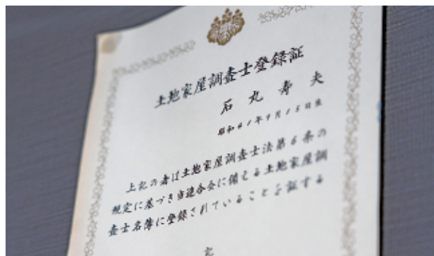
▲土地家屋調査士は、土地または建物の表示に関する登記の専門家。