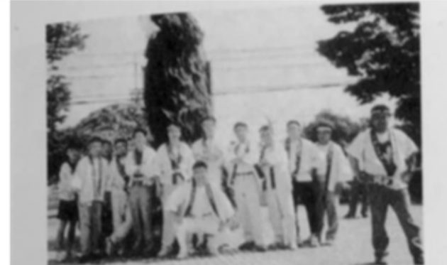
▲第44回全国ろうあ者大会