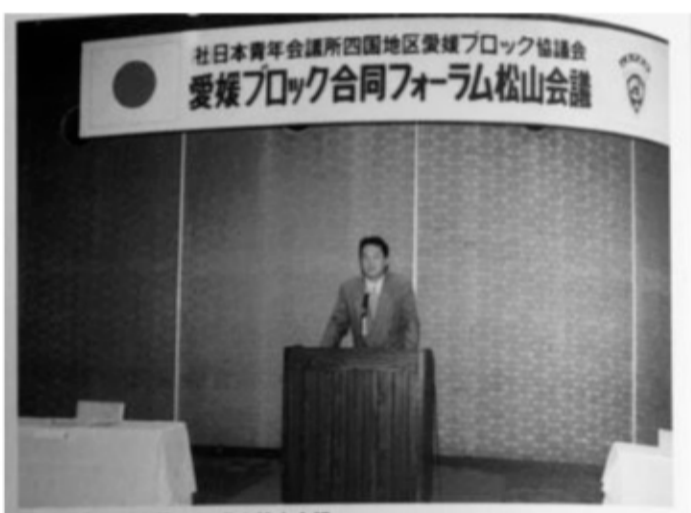
▲愛媛ブロック合同フォーラム松山会議