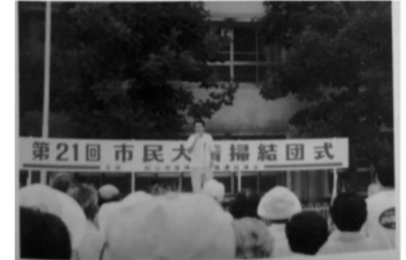
▲第21回松山市民大清掃