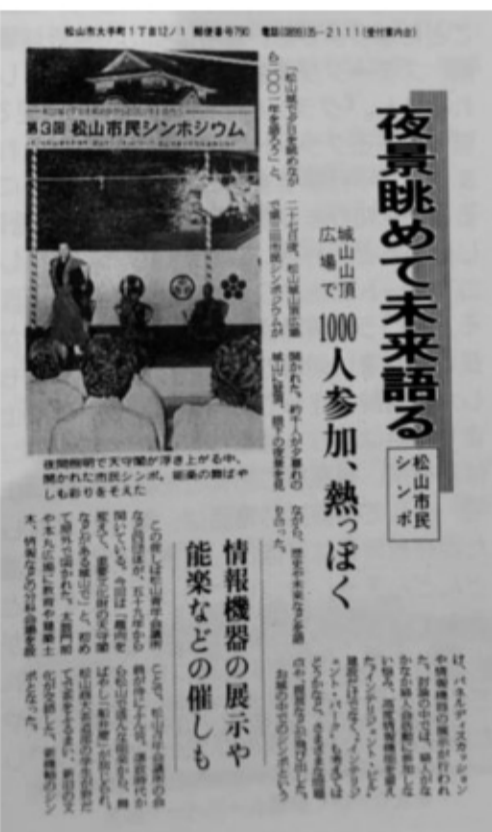
第3回松山市民シンポジウム