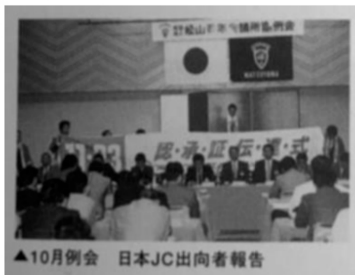
日本JC出向者報告会