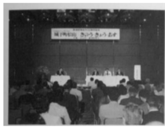
ふるさとシンポジウム開催 「城下町松山きのう・きょう・あす」