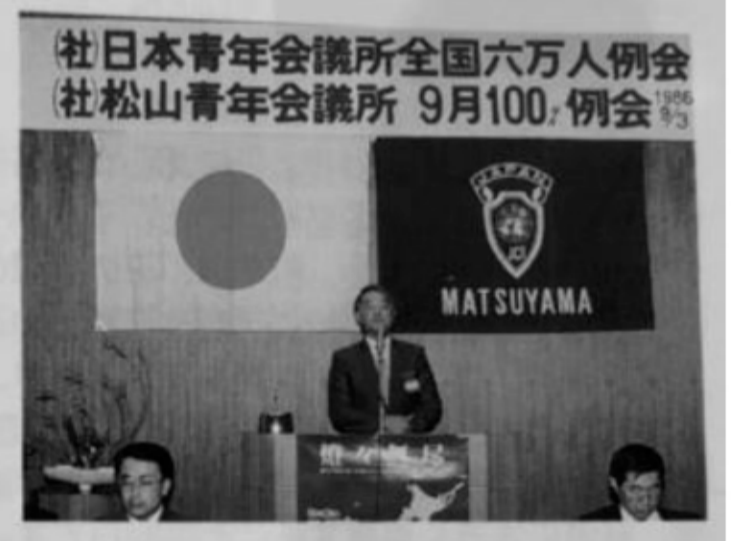
9月例会 (100%例会・全国6万人例会)