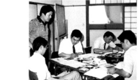
▲マネージメントゲーム