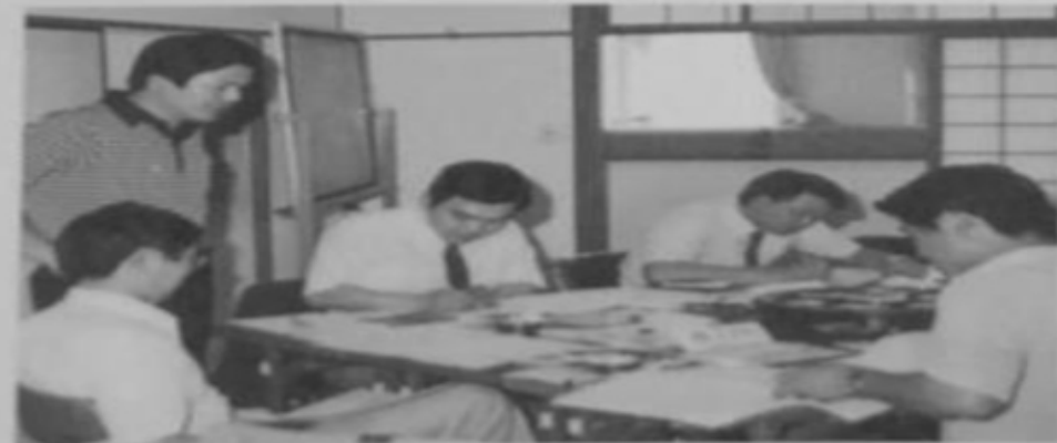
▲マネージメントゲーム